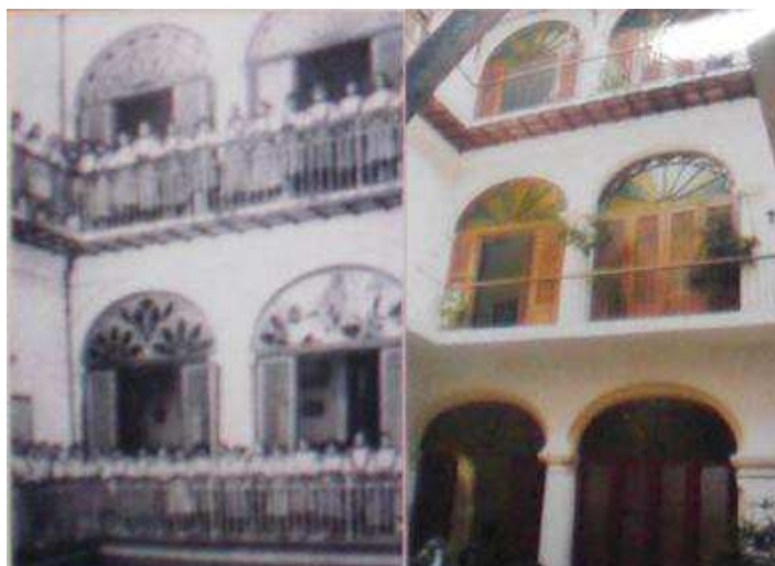
Foto actual del Hostal

Actualmente el Hostal Tejadillo, conserva totalmente el estilo con sus vitrales y ornamentación de madera como podemos observar en las fotos..