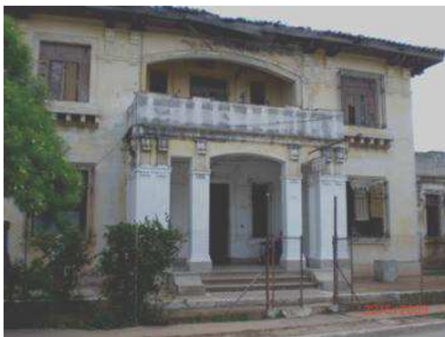
Foto de uno de los edificios de Torrecilla

En 1961 el gobierno revolucionario intervino el Colegio de Marianao. Actualmente es la sede de la Universidad de Ciencias Médicas llamada Girón porque de allí salieron las tropas para combatir la invasión de Playa Girón. Está muy bien conservado el inmueble y hasta con construcciones nuevas respondiendo a sus necesidades.