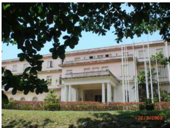
Foto del Colegio de Marianao, actual escuela de Medicina de la Universidad de La Habana

Todavía en el edificio quedan algunos símbolos nuestros que permanecen, como el inmenso vitral detrás de la escalera al fondo de la entrada donde se lee “Cor unum et anima una in Cor de Jesu”