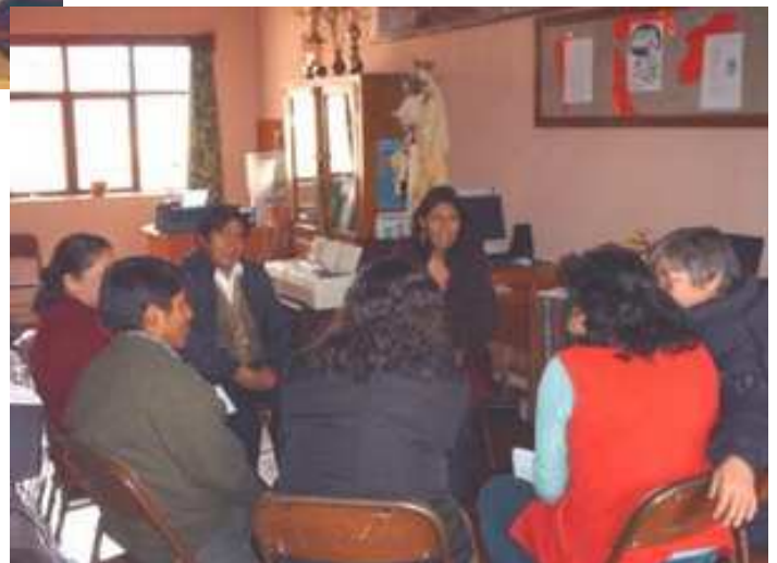
Retiros de preparación para Semana Santa.