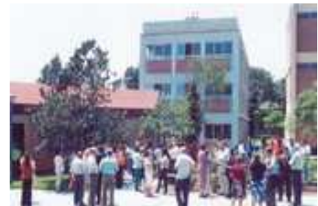
Inauguración del Pabellón de Pastoral Universitaria- Marzo 2008

La UNIFÉ, en el año 2008, desarrollará un programa de celebraciones, austero pero con gran significado académico, cultural y social, para festejar la creación de la Universidad de la Mujer, en el Perú. A través de sus dependencias académicas y administrativas espera cumplir con la planificación y ejecución de un conjunto de actividades que estén orientadas a afianzar el propósito primigenio, con ello, la excelencia académica, la competitividad, la innovación académica, la internacionalización y la promoción de los valores éticos y morales para responder a los cambios sociales y las demandas de la sociedad del conocimiento y de la información, la empresa y el mercado globalizados y altamente competitivos, y en general, para el fortalecimiento de la gestión institucional.