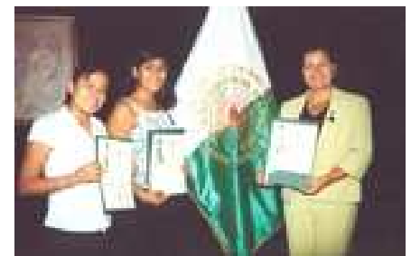
Inicio del Ciclo Académico 2008-I, en los niveles de Pre y Postgrado. Reconocimiento a las ingresantes que ocuparon los primeros puestos en los exámenes de admisión. Marzo 2008

Nos proponemos sostener en el largo tiempo la política orientada a alcanzar la excelencia académica en nuestro quehacer institucional y lograr una comunidad de personas con principios éticos y valores cristianos, para que sean instrumento de su propia realización personal; con capacidad de crítica, reflexión, resolución de problemas, cambio de actitud y de toma de decisiones, frente a los desafíos y las demandas de la sociedad nacional e internacional.