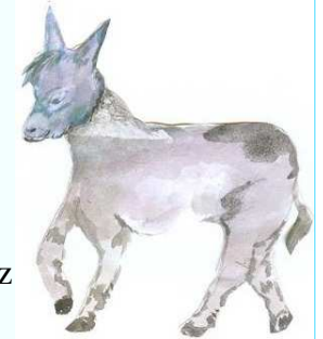
Comunidad de Santa María

BRILLA MI PIEL QUE ES PLATEADA y se ilumina el portal.