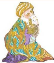
Sus hermanas de LAYO

Pediremos por esta población llena de dignidad, de riquezas humanas, de proyectos, sueños y anhelos profundos. Por estas personas llenas de fe, de esperanza y Amor, para que Jesús los colme de sus bendiciones y haga realidad un mundo mejor en esta Navidad.